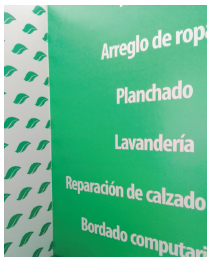
Muestra de viniles colocados en vestidor